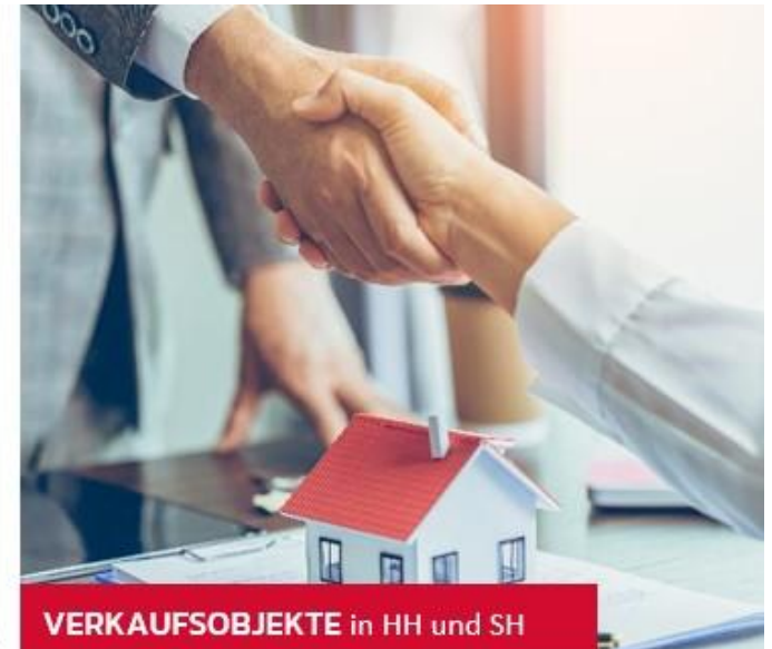
VERKAUFSOBJEKTE in HH und SH