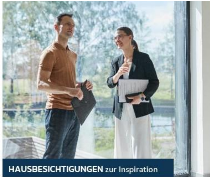
HAUSBESICHTIGUNGEN zur Inspiration