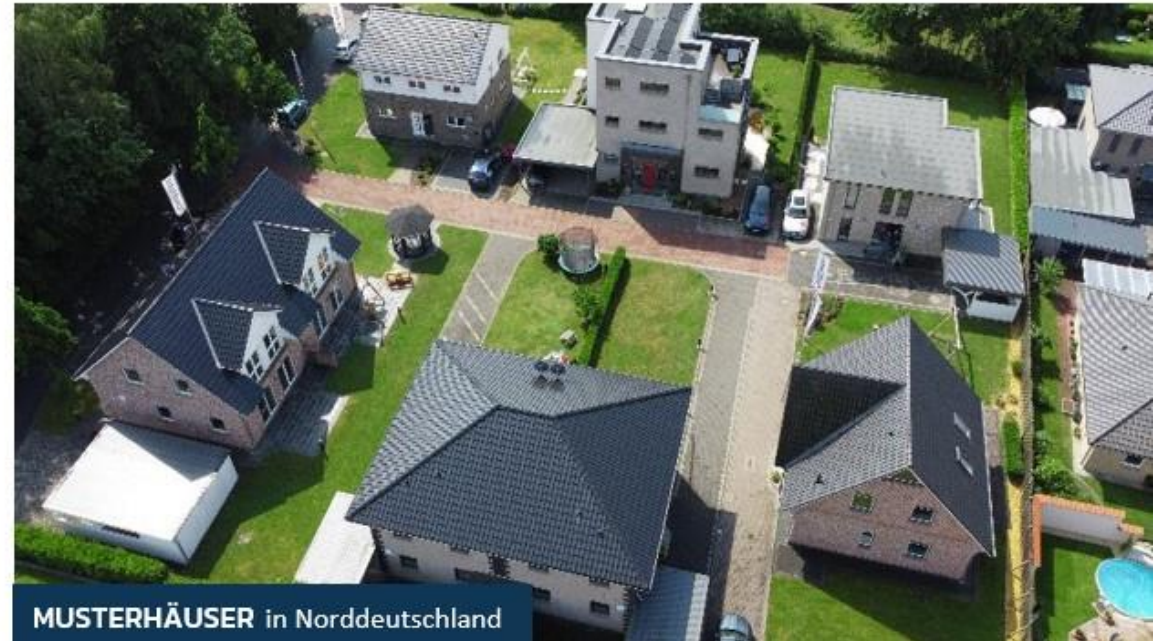
MUSTERHÄUSER in Norddeutschland