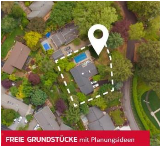
FREIE GRUNDSTÜCKE mit Planungsideen