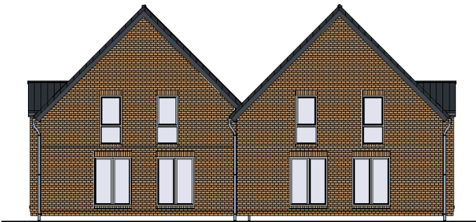
Park als Doppelhaus_no