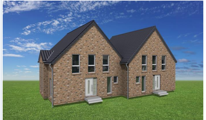
Animation Park als Doppelhaus_3D